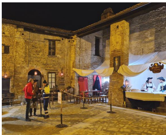
scorcio della piazza ultimata (Rapulè 2022)