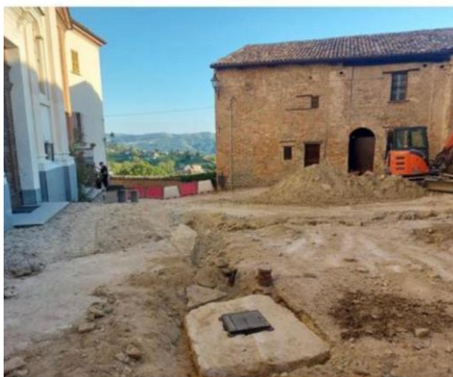
piazza durante il cantiere

L'intervento ha ovviamente interessato anche il rifacimento delle linee elettriche, idriche e fognarie presenti in questo ambito.